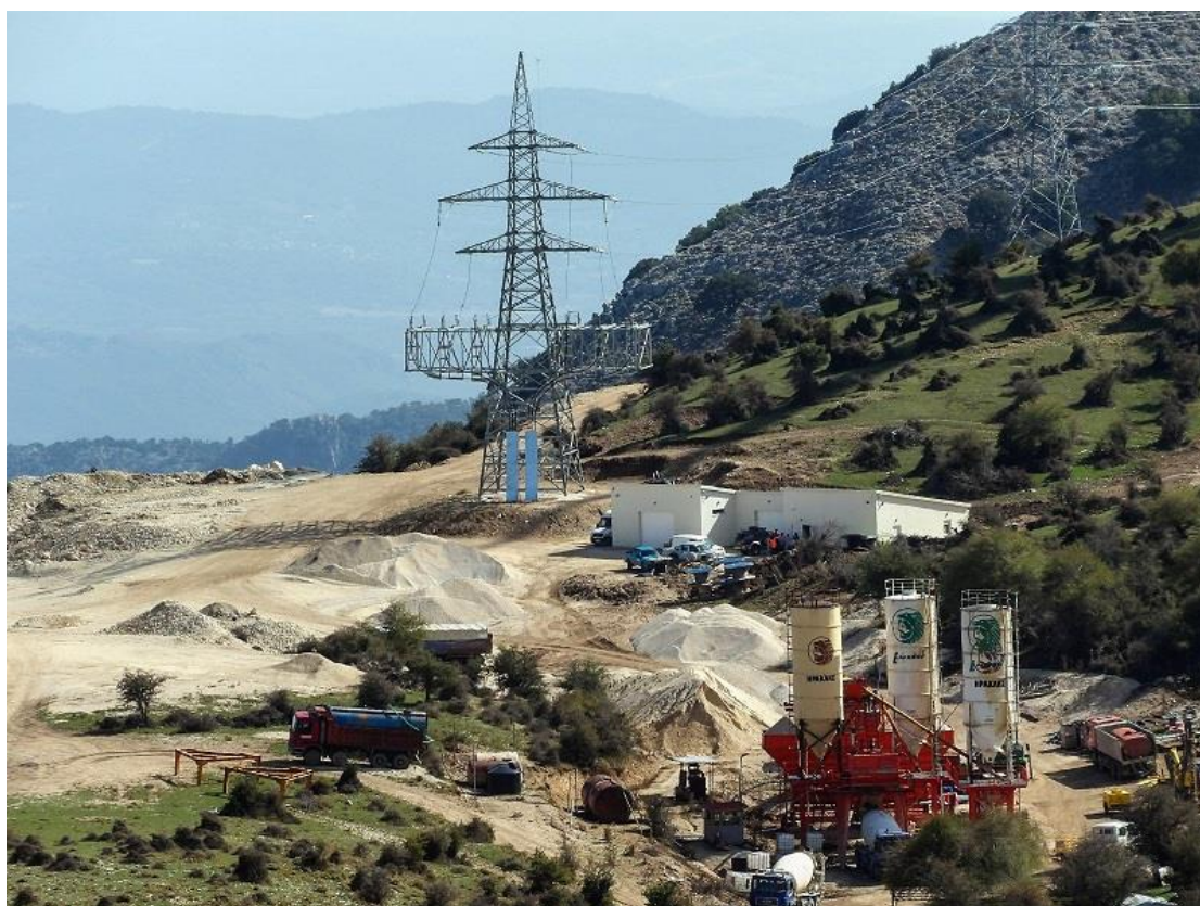
Εικ.4: Δίκτυα μεταφοράς ηλεκτρικής ενέργειας των ΑΣΠΗΕ. Πλήρης καταστροφή του τοπίου, οι επιπτώσεις στην περιοχή του Ασπροπόταμο από τα εκατοντάδες χιλιόμετρα καλώδια και πυλώνες θα είναι τεράστιες.

Όπως σε όλες τις Ευρωπαϊκές χώρες όπου άρχισε η εγκατάσταση αιολικών πάρκων έτσι και στην Ελλάδα πολίτες, φορείς, τοπική αυτοδιοίκηση (πρόσφατα πέντε δήμαρχοι των Αγράφων έστειλαν κοινό ψήφισμα κατά των ΑΣΠΗΕ που απειλούν να καταστρέψουν μια άλλη μοναδική και αλώβητη περιοχή της Πίνδου, αλλά και πολλοί άλλοι δήμαρχοι), περιβαλλοντικές οργανώσεις κτλ άρχισαν να εναντιώνονται μαζικά στην λαίλαπα των ΑΣΠΗΕ. Περιοχές απείρου φυσικού κάλλους που προσελκύουν χιλιάδες επισκέπτες αλλά και αποτελούν πηγές σημαντικής δραστηριότητας και ενδυνάμωσης της τοπικής οικονομίας όπως κτηνοτροφία, υλοτομία, γεωργία αλλά και εναλλακτικών μορφών πεζοπορικού, ορειβατικού τουρισμού κτλ έχουν ήδη καταστραφεί ή απειλούνται με καταστροφή. Ολόκληρη η Πίνδος - η ραχοκοκαλιά της χώρας, ο πνεύμονας και ο υδροδότης ολόκληρης της χώρας- (Βαρνούντας, Γράμμος, Βασιλίτσα, Λυγκος, Ασπροπόταμος, Άγραφα, Οίτη) αλλά και η Μάνη, το Βέρμιο, τα Πιέρια και κάθε σχεδόν Ελληνικό βουνό έχουν μπει στο μάτι του κυκλώνα των «πράσινων» επενδυτών και κινδυνεύουν ΑΜΕΣΑ!