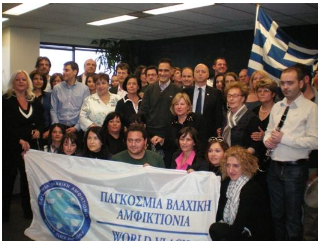
Η ελληνική αποστολή επισκέφτηκε τον Γενικό Πρόξενο της Ελλάδος στο Τορόντο κ. Δημήτρη Αζεμόπουλο.