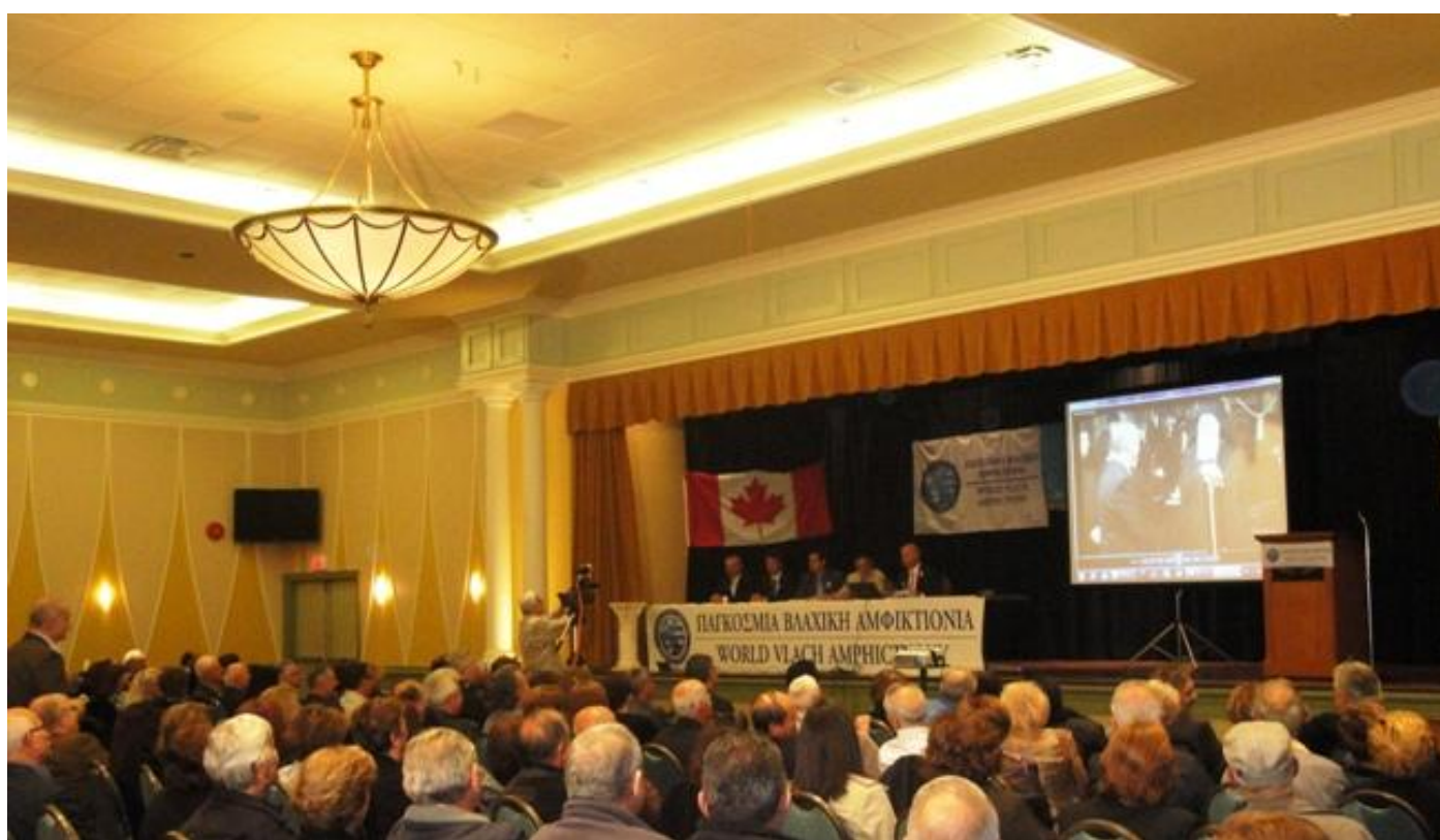
Γενική άποψη της 3η ανοιχτής συνδιάσκεψης της Παγκόσμιας Βλαχικής Αμφικτιονίας.