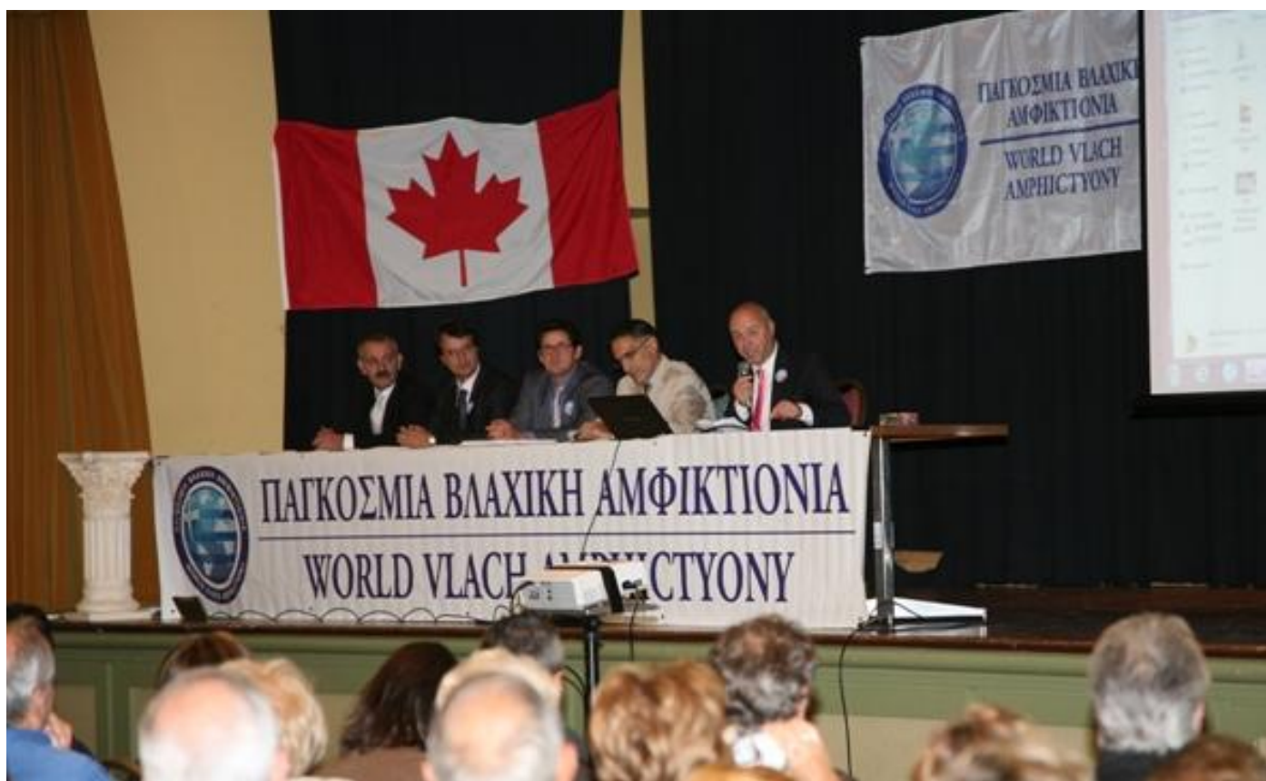
3η ανοιχτή συνδιάσκεψη της Παγκόσμιας Βλαχικής Αμφικτιονίας που έλαβε χώρα στο Τορόντο του Καναδά την Δευτέρα 8 Οκτωβρίου 1012 στο METROPOLITAN CENTRE.