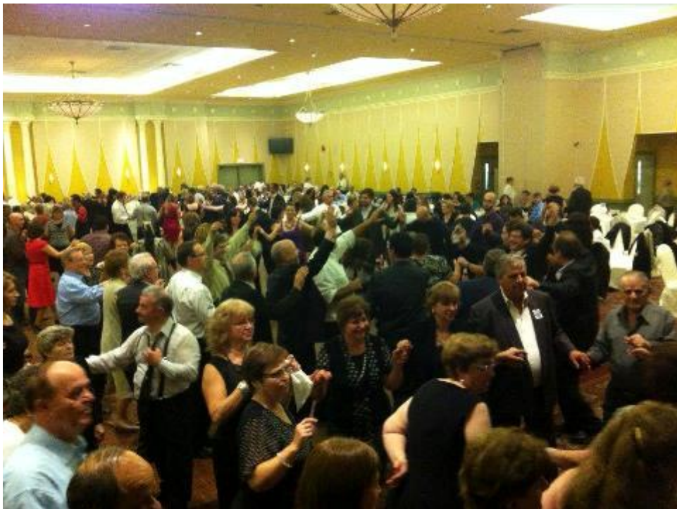
Ετήσιος χορός της Ένωσης Βλάχων Ελλάδος Καναδά.