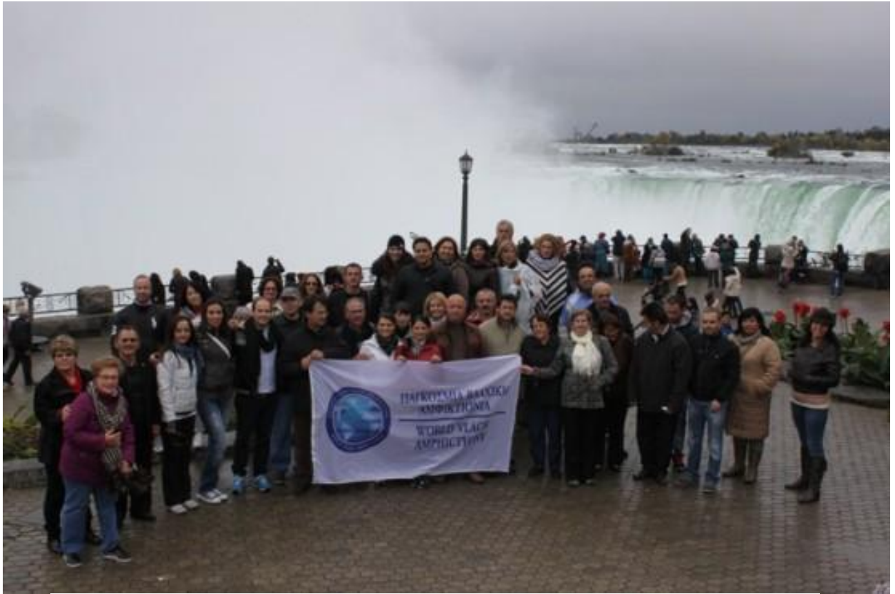
Η ελληνική αποστολή στους καταρράκτες του Νιαγάρα.